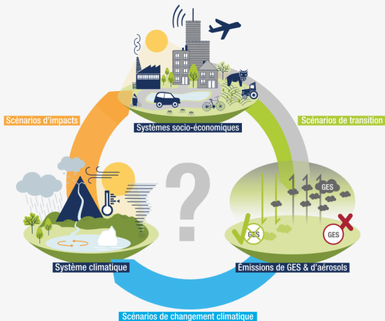
FIGURE 1. LES INTERACTIONS ENTRE LE CLIMAT ET LES SYSTÈMES SOCIO-ÉCONOMIQUES EXPLORÉES PAR LES TROIS FAMILLES DE « SCÉNARIOS LIÉS AU CLIMAT »